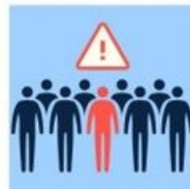
Évitez les foules