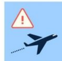
Évitez si possible de voyager dans les zones infectées