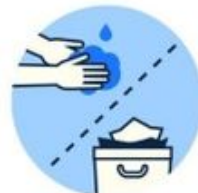
Lavez-vous les mains et jetez vos mouchoirs

POUR PLUS D'INFORMATIONS: WWW.INFO-CORONAVIRUS.BE 0800 146 89