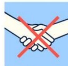
Évitez les poignées de main