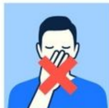
Évitez de vous toucher les yeux, le nez et la bouche