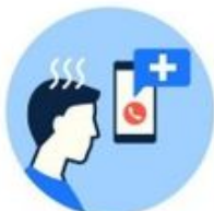
Si vous tombez malade, appelez immédiatement votre médecin