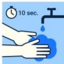
Lavez-vous souvent les mains (au moins 10 sec.)