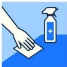
Gardez les objets et les surfaces propres