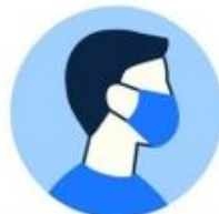
Portez un masque si vous êtes malade