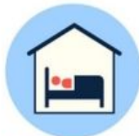
Restez chez vous