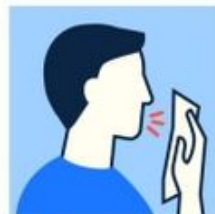
Couvrez votre bouche et votre nez quand vous toussiez ou éternuez