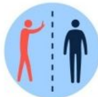
Évitez les contacts